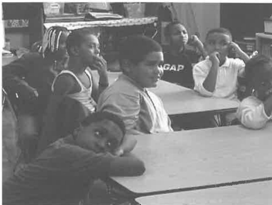
Figura 4: Enseñando y aprendiendo álgebra en salones de tercer grado en escuelas públicas de Boston, Estados Unidos.

VM: Desde hace veinte años, en Argentina, asistimos a un fenómeno recurrente: cada vez hay menos estudiantes de ciencias matemáticas, físicas y químicas, justamente porque no terminan el secundario. Una de las mayores trabas es la matemática. Creo que lo que está sucediendo es que casi no se está enseñando matemática en el sentido del pensamiento matemático, en lo que realmente es epistemológicamente matemático. La enseñanza se restringe a operar con números... Realmente creo que es un debate que debe darse en nuestra sociedad: ¿queremos que los ciudadanos o los estudiantes puedan y sepan pensar matemáticamente? Quienes no cuentan con esta capacidad sufren discriminación, quedando afuera del real acceso al conocimiento.